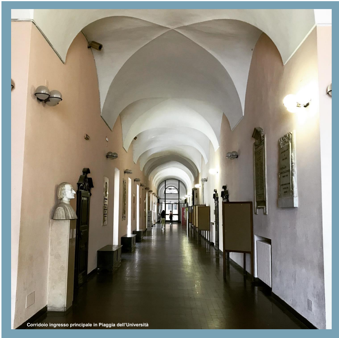
Corridoio ingresso principale in Piaggia dell'Università

con la redazione di un nuovo Statuto; numerose iniziative si susseguono con particolare attenzione al potenziamento della didattica; s'incrementano i corsi, si organizza l'Istituto di esercitazioni giuridiche; si crea la Scuola di perfezionamento in diritto agrario e in economia e statistica agraria. Nel secondo dopoguerra l'Università è attenta ad accrescere, in relazione alle emergenti esigenze, il proprio patrimonio di strutture didattiche e logistiche seguendo una concreta politica di scelte culturali di tipo umanistico nella prospettiva di ampliamento e potenziamento del rapporto Università territorio. Segno tangibile di tale politica, dopo la realizzazione negli anni sessanta della nuova Facoltà di Lettere e Filosofia, è stata la costituzione delle Facoltà di Scienze Politiche, Economia, Scienze della Comunicazione e Scienze della Formazione.