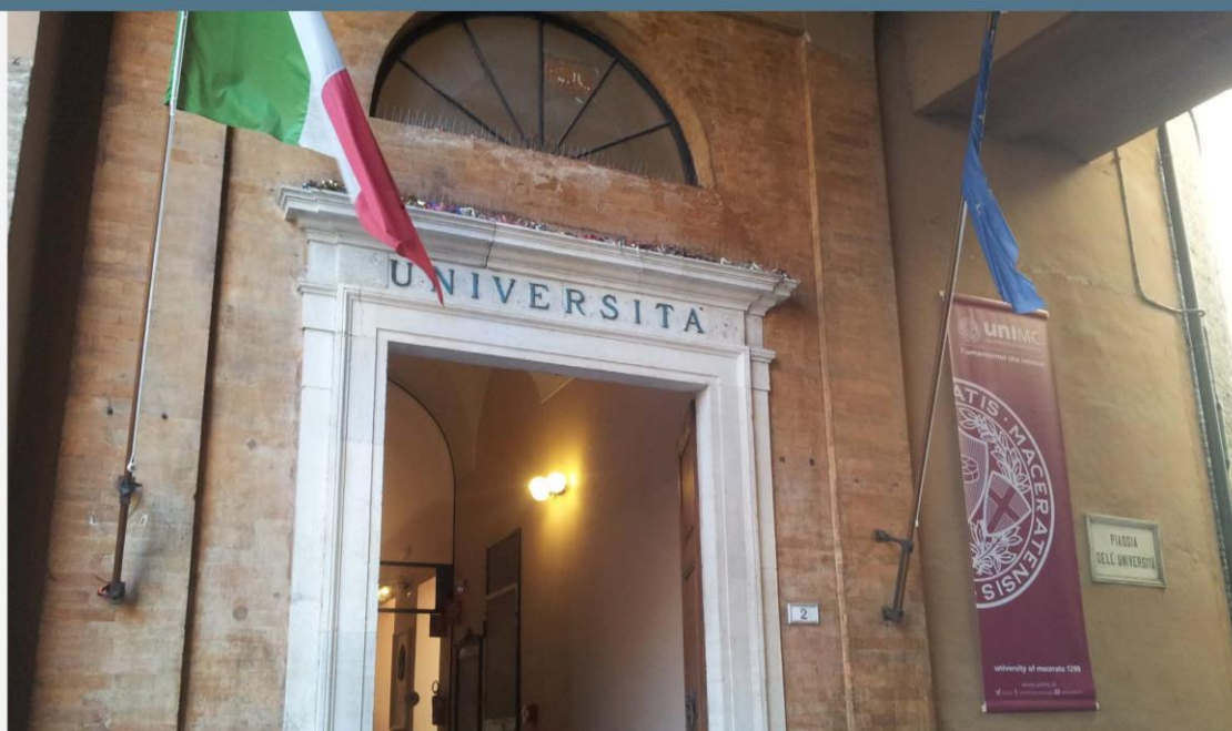
Giurisprudenza | Ingresso principale